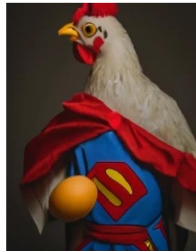
Grupa Superkur znoszących ponadprzeciętną ilość jaj

I przez rok rozmnażał kury w obydwóch grupach - to dało mu 5 kolejnych kurzych pokoleń.