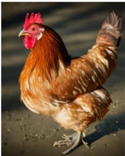
Grupa kur znoszących średnią ilość jaj